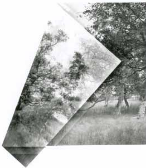
ALIKI BRAINE (2016) »Folded (Homage à Corot) #3« Black and white photograph (folded negative) 56 x 65 cm Edition 2/5