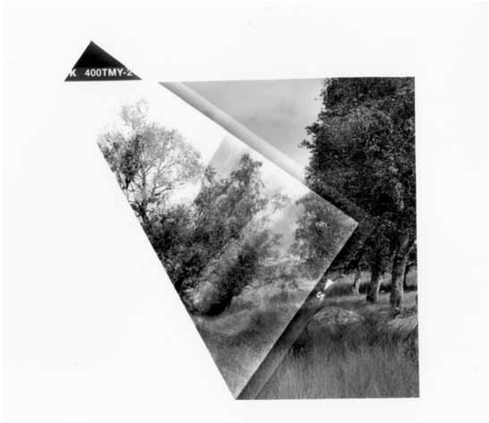
ALIKI BRAINE (2016) »Folded (Homage à Corot) #2« Black and white photograph (folded negative) 56 x 65 cm Edition 2/5