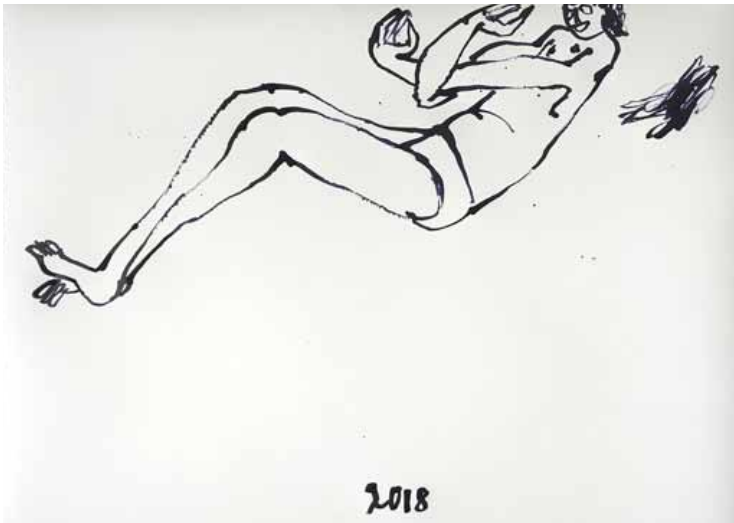
JOSEF ZEKOFF (2018) Ohne Titel (Apelles) Ink on paper 58 x 38 cm Unique