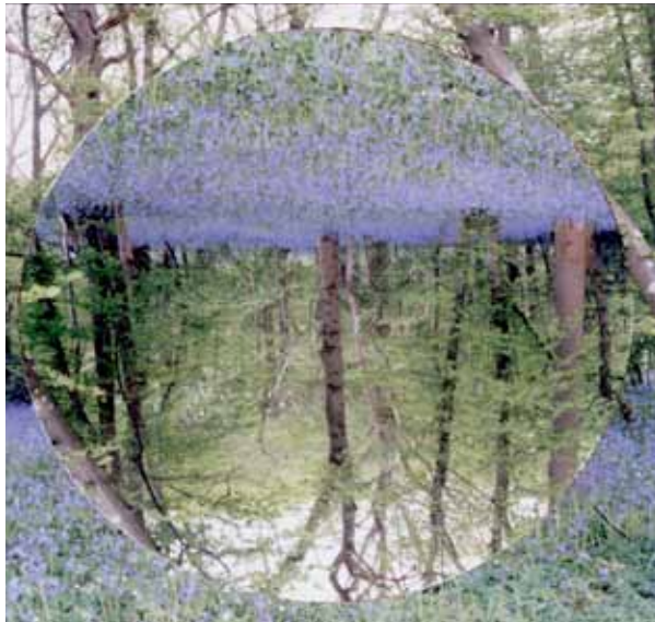
ALIKI BRAINE (2017) In the Beginning (Bluebell Wood 1)« Colour photograph with cut and repositioned negative 60 x 60 cm Edition 1/5