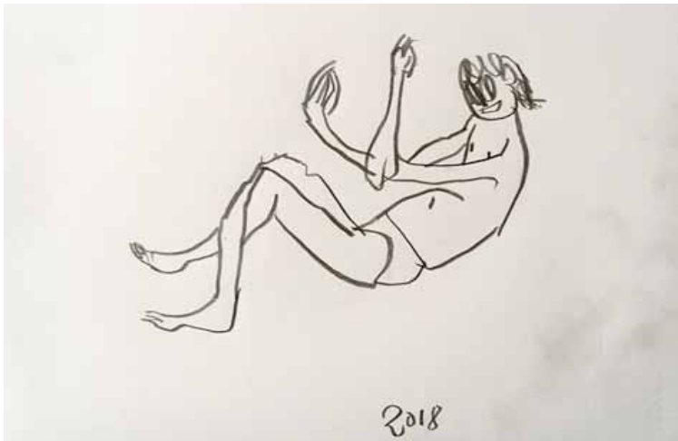
JOSEF ZEKOFF (2018) »Ohne Titel (Apelles)« Graphite on paper 26,5 x 38 cm Unique