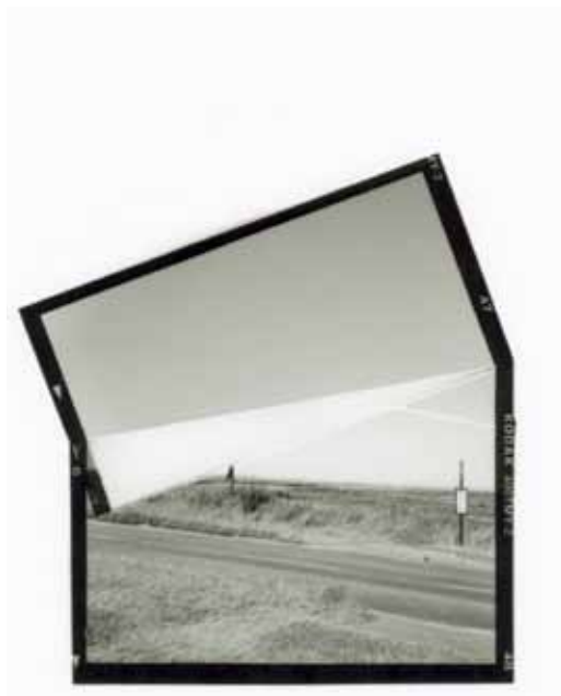
ALIKI BRAINE (2018) »Sky Lines (Norfolk no. 4)« Black and white photograph (folded negative) 30,5 x 24 cm Edition 2/5 + 1 AP