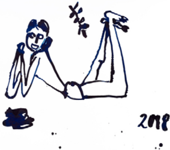
JOSEF ZEKOFF (2018) Ohne Titel Ink on paper 38 x 26,5 cm Unique