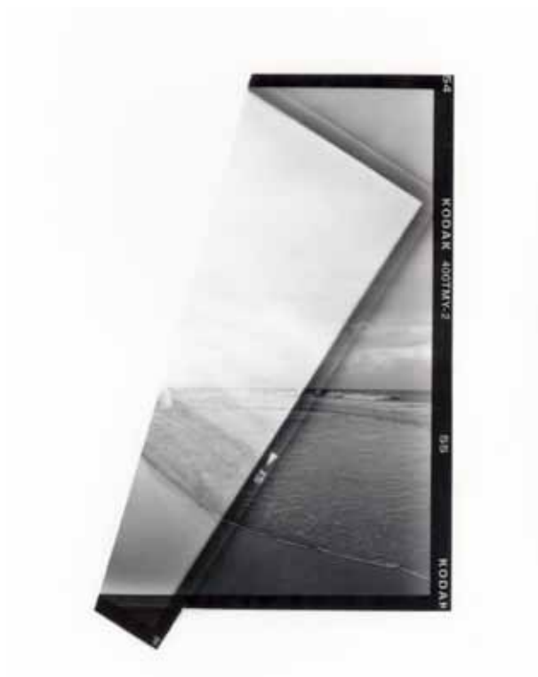
ALIKI BRAINE (2017) »Where Two Seas Meet (Skagen no.1)« Black and white photograph (folded negative) 30,5 x 24 cm Edition 2/5 + 1 AP