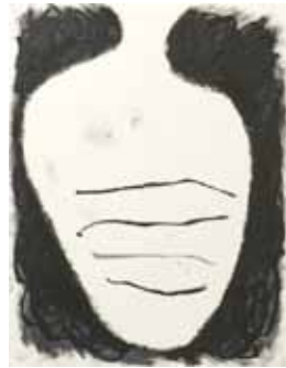
JOSEF ZEKOFF (2016) From the series Ohne Titel (Gefäss) Oil pastel on paper 53 x 76 cm Unique