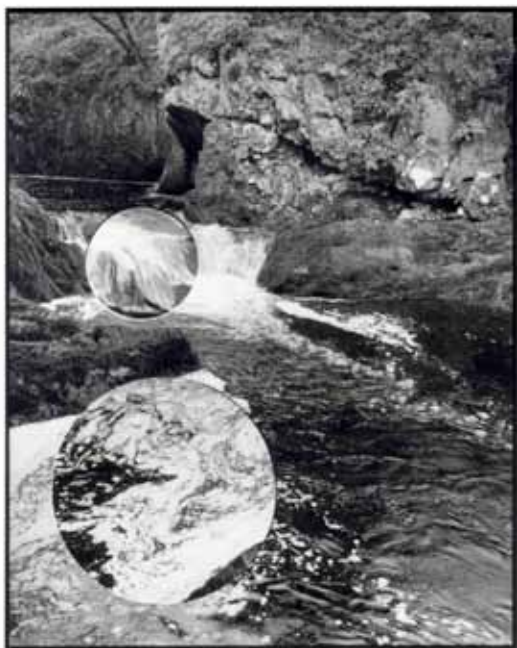
ALI KI BRAINE (2017) »Falling Up #4« Black and white photograph from cut and replaced negative 70,5 x 58 cm Edition 1/3