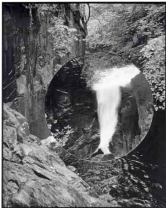
ALIKI BRAINE (2017) »Falling Up #7« Black and white photograph from cut and replaced negative 70,5 x 58 cm Edition 1/3